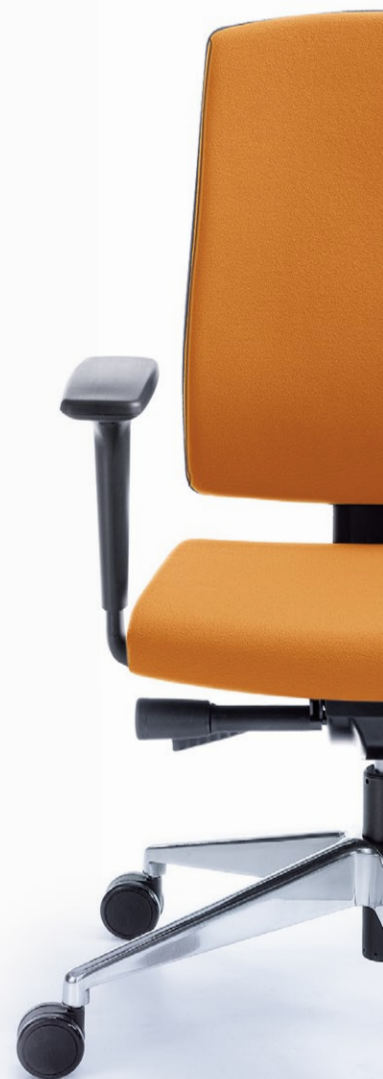
RAYA 23SL CZARNY P51PU + BAZA CHROM