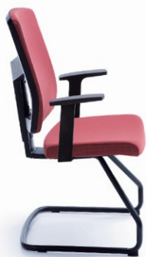
RAYA 21V CZARNY P46PU