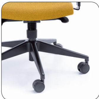
baza czarna black base