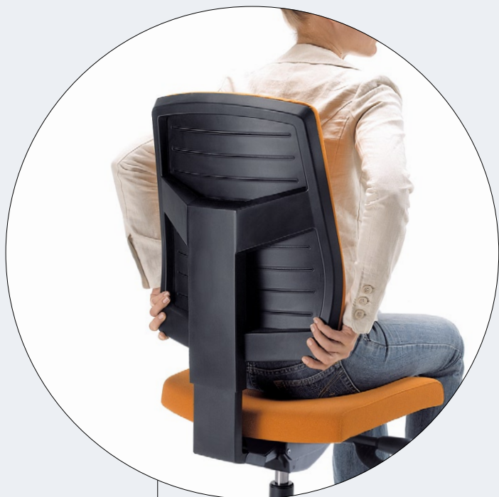
Regulacja wysokości oparcia (w wersji obrotowej) Backrest height adjustment (in swivel version)