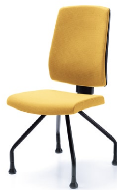
RAYA 23H CZARNY STOPKI