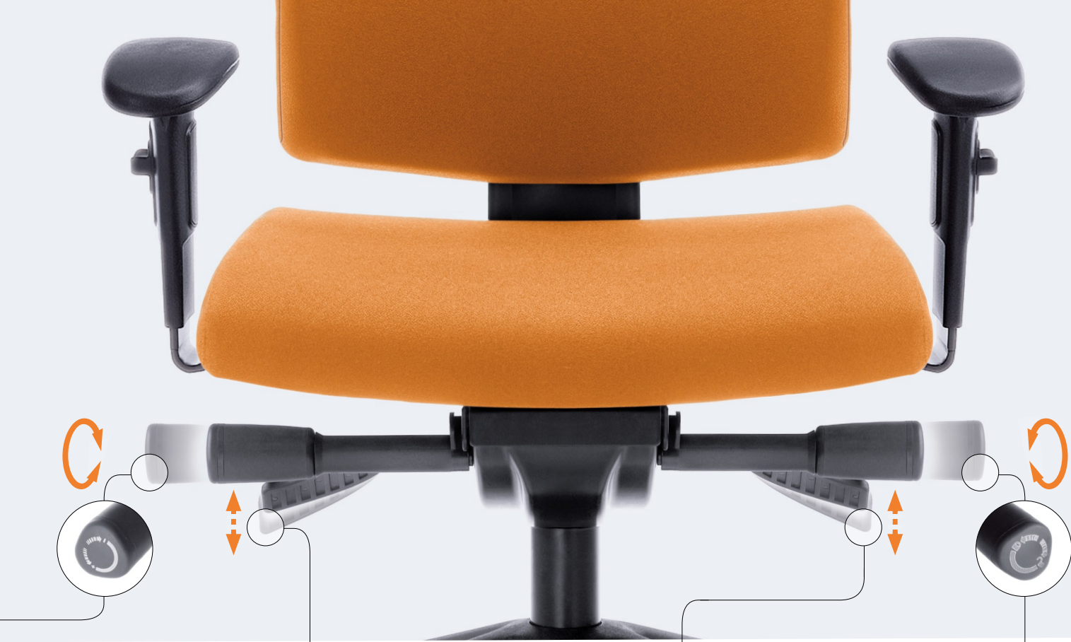
Regulacja wysokości siedziska Seat height adjustment