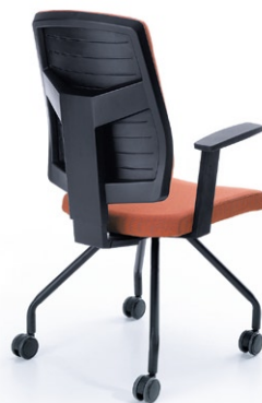
RAYA 21H CZARNY P46PU KÓLKA