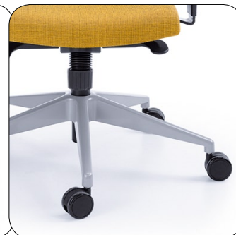
baza metalik base metallic