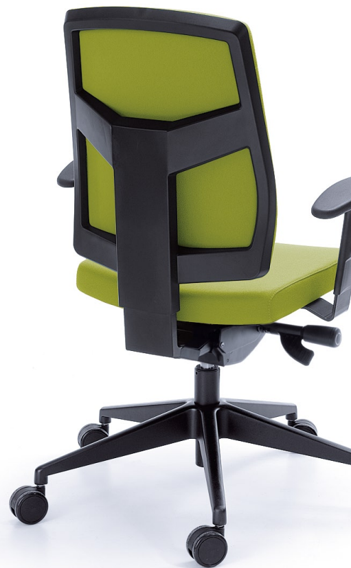
RAYA 21S CZARNY P49PU + BAZA METALIK