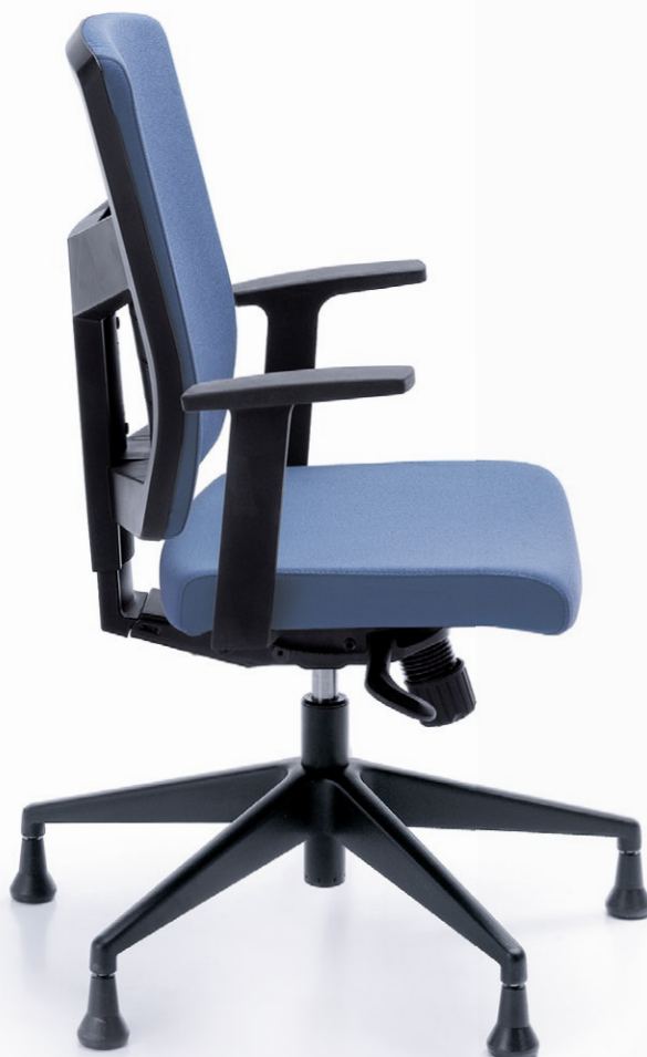
RAYA 21S CZARNY P46PU