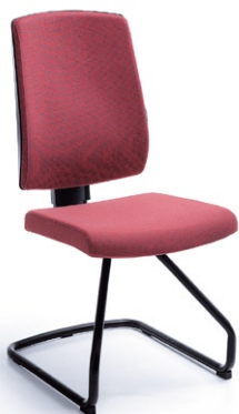
RAYA 21V CZARNY