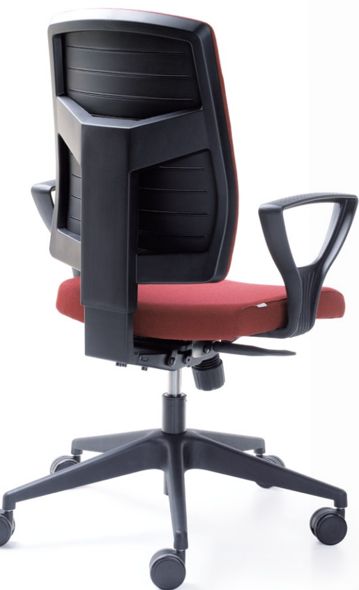
RAYA 21S CZARNY P52PA