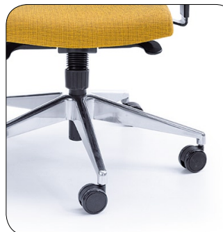
baza chrom base chrome