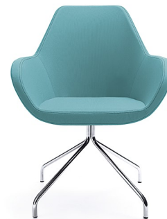
FAN 10H CHROM