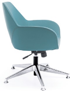
FAN 10T CHROM