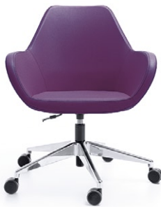
FAN 10E CHROM