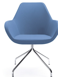
FAN 10HS CHROM