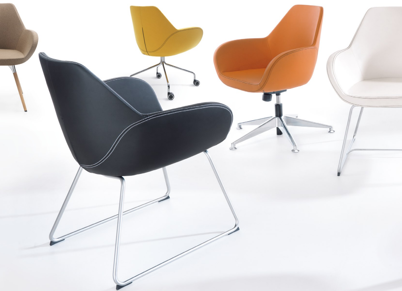
FAN 10HW WOOD