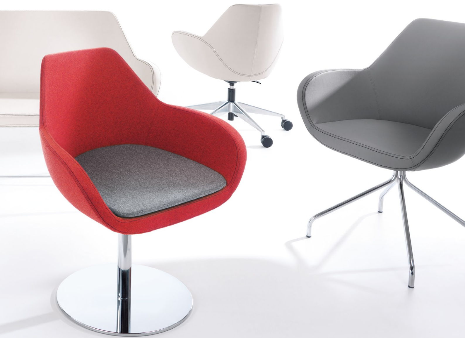
FAN 10R CHROM + poduszka