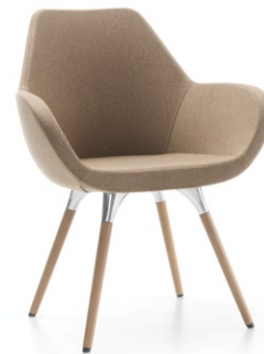
FAN 10HW WOOD