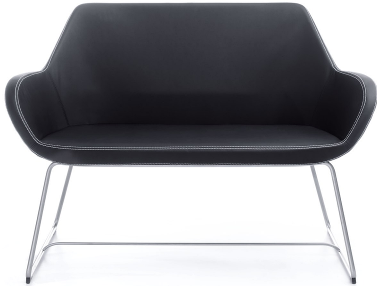
FAN 20V SATYNA