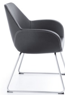
FAN 10V SATYNA