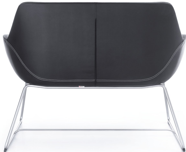
FAN 20V SATYNA