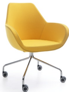
FAN 10HC CHROM