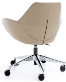
FAN 10E CHROM